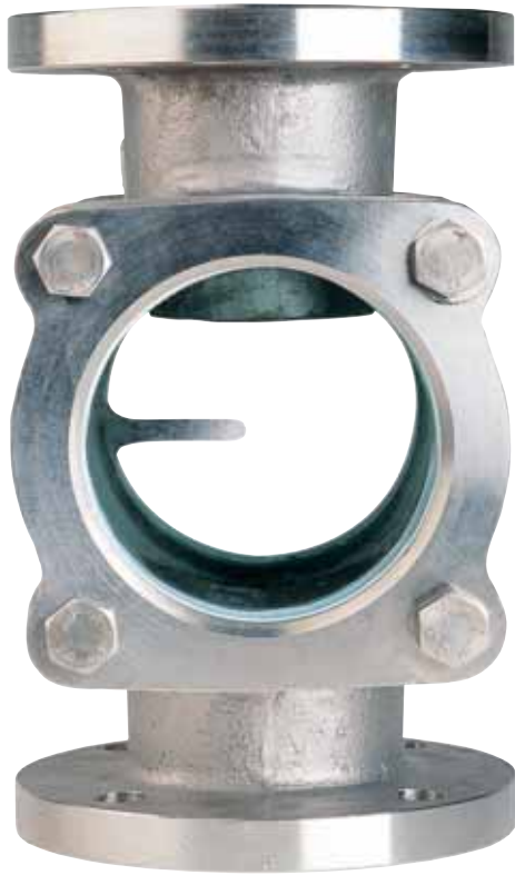
Fig. VS 114 SERIE PN-10